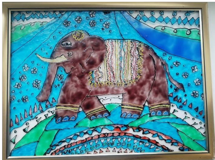
Рисование по стеклу